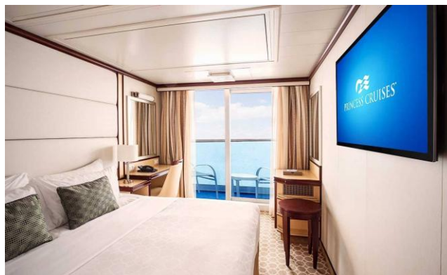
Cabina cu balcon